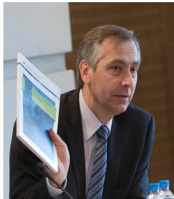
Kommissar Figel mit dem jüngsten Bericht des Cedefop über die europäische Berufsbildungspolitik mit dem Titel „Kontinuität, Konsolidierung und Wandel“

dass sie den Anforderungen des Arbeitsmarktes besser gerecht wird. Darüber hinaus wollen die Länder mehr Menschen für berufliche Ausbildungsgänge gewinnen. Nach einer Analyse des Cedefop auf der Grundlage von Eurostat-Bevölkerungsprognosen aus dem Jahr 2004 wird es 2030 etwa 600 000 junge Absolventen beruflicher Bildungsgänge weniger als 2005 geben.