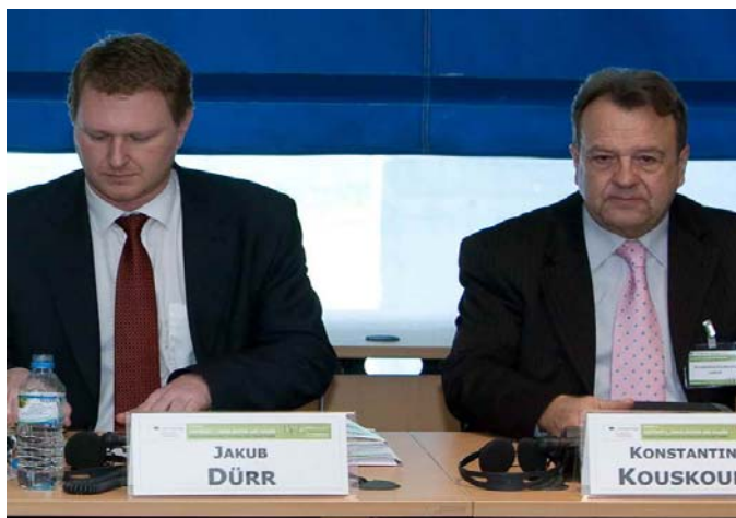
Jakub Dürr, stellvertretender Minister für Bildung der Tschechischen Republik, und Konstantinos Kouskoukis, Generalsekretär für lebenslanges Lernen des griechischen Ministeriums für Bildung und Religiöse Angelegenheiten

Obwohl es Fortschritte und zahlreiche Beispiele für gute Praxis gibt, wurde auf der Konferenz betont, dass die Reformen nach wie vor in greifbare Ergebnisse umgesetzt werden müssen. Die Fortschritte bei der Erreichung der Maßstäbe der EU für allgemeine und berufliche Bildung sind enttäuschend. So nehmen zum Beispiel nur etwa 9,7 % der erwachsenen Erwerbstätigen am lebenslangen Lernen (das größtenteils berufsbildender Natur ist) teil. Dieser Anteil liegt deutlich unter der EU-Zielmarke von 12,5 % für das Jahr 2010. Europäische Instrumente wurden zwar entwickelt, müssen jedoch noch in die Praxis umgesetzt werden. Die Qualifikationsrahmen haben noch keine spürbare Bedeutung für die berufliche oder räumliche Mobilität der Menschen. Die Mitgliedstaaten arbeiten daran, die nationalen Qualifikationsrahmen mit dem EQR zu verknüpfen und nationale Qualitätssicherungsrahmen für die Berufsbildung zu schaffen. Beides sind anspruchsvolle Aufgaben. Das europäische Leistungspunktesystem für die Berufsbildung erfordert noch erhebliche weitere Anstrengungen. Die Anerkennung des nicht formalen und informellen Lernens ist nicht billig, wie Patrick Werquin von der OECD erläuterte. Er wies auf der Konferenz darauf hin, dass es nach wie vor unklar ist, ob der Nutzen dieser Form des Lernens die Kosten aufwiegt, vor allem weil die Ergebnisse möglicherweise gesellschaftlich nicht voll anerkannt werden.